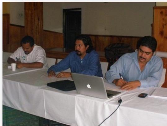
Aspectos de la mesa de discusión sobre el Observatorio Campesino y Políticas Públicas