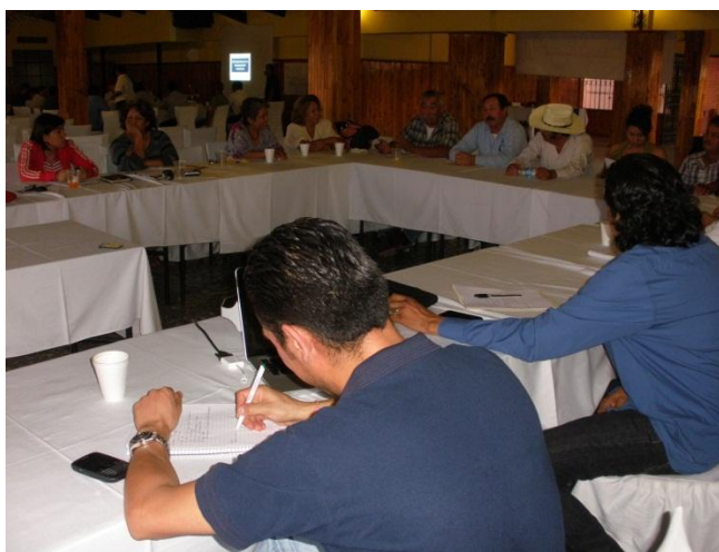
Mesa de trabajo sobre el Observatorio Campesino de Políticas Públicas