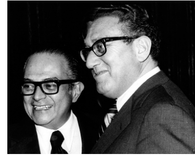
AZEREDO DA SILVEIRA E HENRY KISSINGER