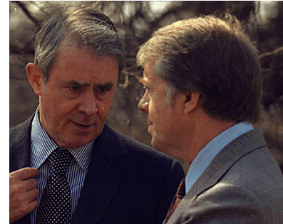
SECRETARIO DE ESTADO CYRUS VANCE E PRESIDENTE JIMMY CARTER

Era lógico que os Estados Unidos pressionassem e buscassem enfrentar os dois. Tudo isso partiu de uma desconfiança natural. E era lógico e natural que Brasil e Argentina perseguissem o mesmo objetivo, que não era competir entre eles,