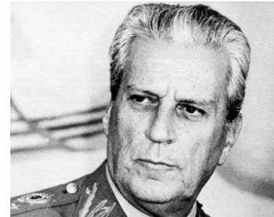
GENERAL LEÔNIDAS PIRES GONÇALVES

Acredito, portanto, que Figueiredo teve um papel importante, sobretudo em sua intervenção para tranquilizar algum setor das Forças Armadas que pudesse estar inquieto em relação à Argentina. É verdade que a maioria das Forças Armadas brasileiras naquele momento estavam bem inclinadas à cooperação com a Argentina, mas podiam ainda estar presentes ressentimentos que Figueiredo de alguma maneira dissipava.