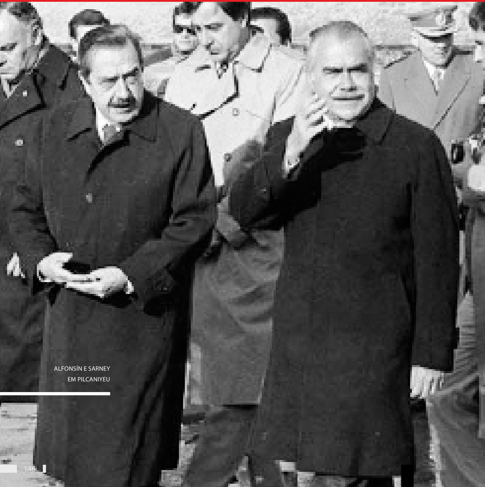
ALFONSÍN E SARNEY EM PILCANIYEU