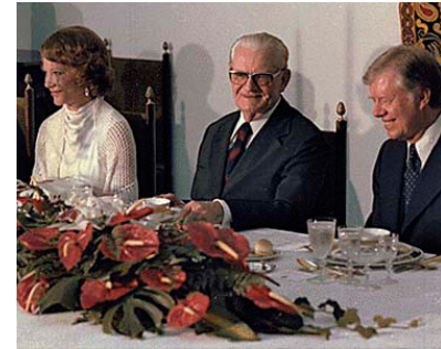
ROSALYN CARTER, ERNESTO GEISEL E JIMMY CARTER, BRASÍLIA, 1978

Obrigado. Nossa a intenção agora é chegar até 18 de novembro de 1983, quan-