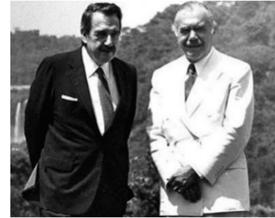
PRESIDENTES ALFONSÍN E SARNEY

Gostaria de dar-lhes as boas-vindas. É um enorme prazer tê-los conosco. Concebi a ideia de aplicar a metodologia da história oral crítica ao caso Argentina-Brasil em temas nucleares ainda em 2008, quando estava iniciando o que se tornou meu projeto sobre os desafios à construção de confiança no mundo nuclear. Eu queria explorar o papel da confiança no estabelecimento da coope-