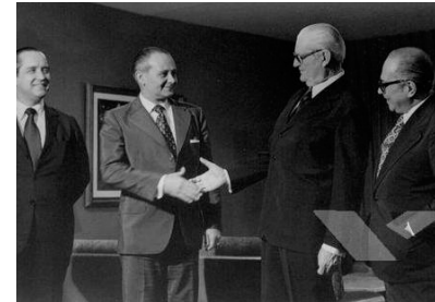
ESQ. PARA DIR.: EMBAIXADOR CAMILIÓN, CHANCELER GUZETTI, PRESIDENTE GEISEL E CHANCELER AZEREDO DA SILVEIRA EM BRASÍLIA, 9 DE DEZEMBRO DE 1976

Agora, o que sim podíamos imaginar entre ambos os países era algo como um tratado de não-proliferação aberto entre Brasil e Argentina com base em um mecanismo que mais ou menos permitisse a cada um dos dois países saber quais eram os desenvolvimentos do outro e dessa maneira estabelecer um vínculo de confiança. Quero dizer que nós já concebíamos como uma resposta possível aos argumentos norte-americanos, entre 1975 e 1977, um mecanismo