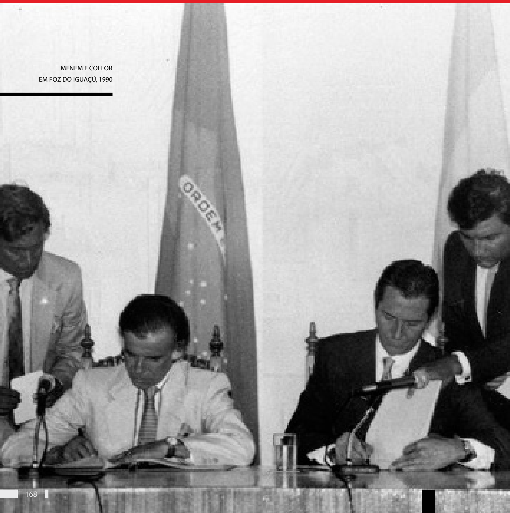
MENEM E COLLOR EM FOZ DO IGUAÇU, 1990