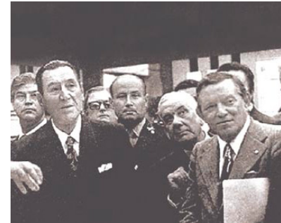
PERÓN INAUGURA ATUCHA EM 21 DE MARÇO DE 1974

Como ex-membro das Forças Armadas vou fazer uma confissão: o fato de que se escolha uma hipótese de guerra determinada é uma das formas que as Forças Armadas têm de justificar sua existência, seu equipamento e seu orçamento. A Argentina tinha uma hipótese de guerra que era muito mais complicada. Era lutar contra Brasil e Chile ao mesmo tempo. Partia-se do princípio de que o Chile aproveitaria a oportunidade de uma guerra entre Argentina e Brasil para recuperar os territórios que a Argentina ocupara na Patagônia. E ainda mais, vou lhes fazer uma outra inconfidência. Eu, em um exercício de guerra na Escola de Guerra Naval, já sendo oficial a nível de chefe, fui designado coman-