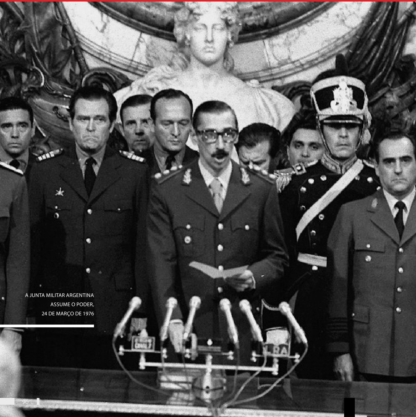
A JUNTA MILITAR ARGENTINA ASSUME O PODER, 24 DE MARÇO DE 1976