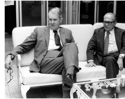
CYRUS VANCE E AZEREDO DA SILVEIRA EM BRASÍLIA

Quando Vance chegou a Brasília trazendo um ultimato do presidente [Jimmy] Carter, eu estava à frente da embaixada e pude presenciar o que, creio, foi uma