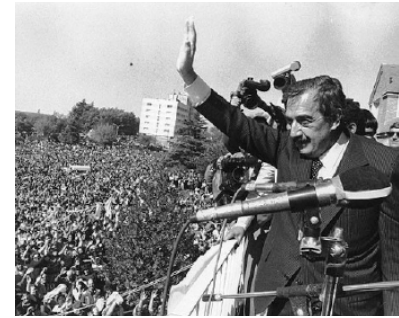
RAÚL ALFONSÍN COMEMORA A VITÓRIA EM 1983