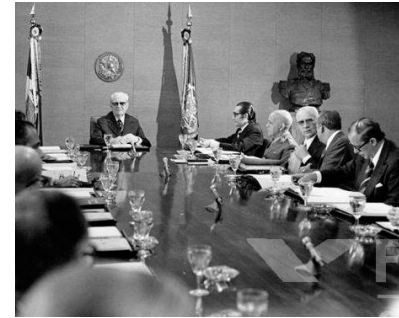
PRESIDENTE GEISEL E SEU MINISTÉRIO