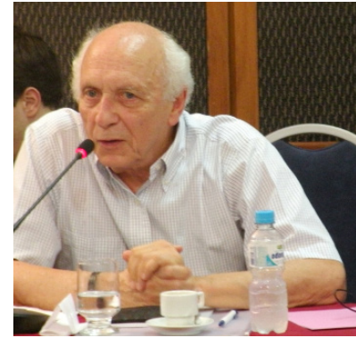
EMBAIXADOR RUBENS RICUPERO

Terceira: o Iraque da época ainda não era uma figurinha difícil em política internacional. Por exemplo, pouco tempo depois da primeira etapa do avanço da relação do Brasil com o Iraque, o vice-presidente do Iraque visitou a Argentina e foi recebido pelo governo argentino com toda a normalidade. Não havia naquele momento uma imagem como a que se criou posteriormente. O lógico é que o tema tivesse passado relativamente inadvertido. À época, o Iraque não era um ator internacional de peso ou que significasse uma ameaça.