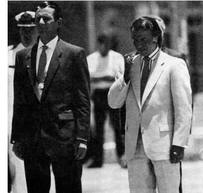
COLLOR E MENEM ESTABELECEM INSPEÇÕES NUCLEARES MÚTUAS EM FOZ DO IGUAÇÚ, 28 DE NOVEMBRO DE 1990