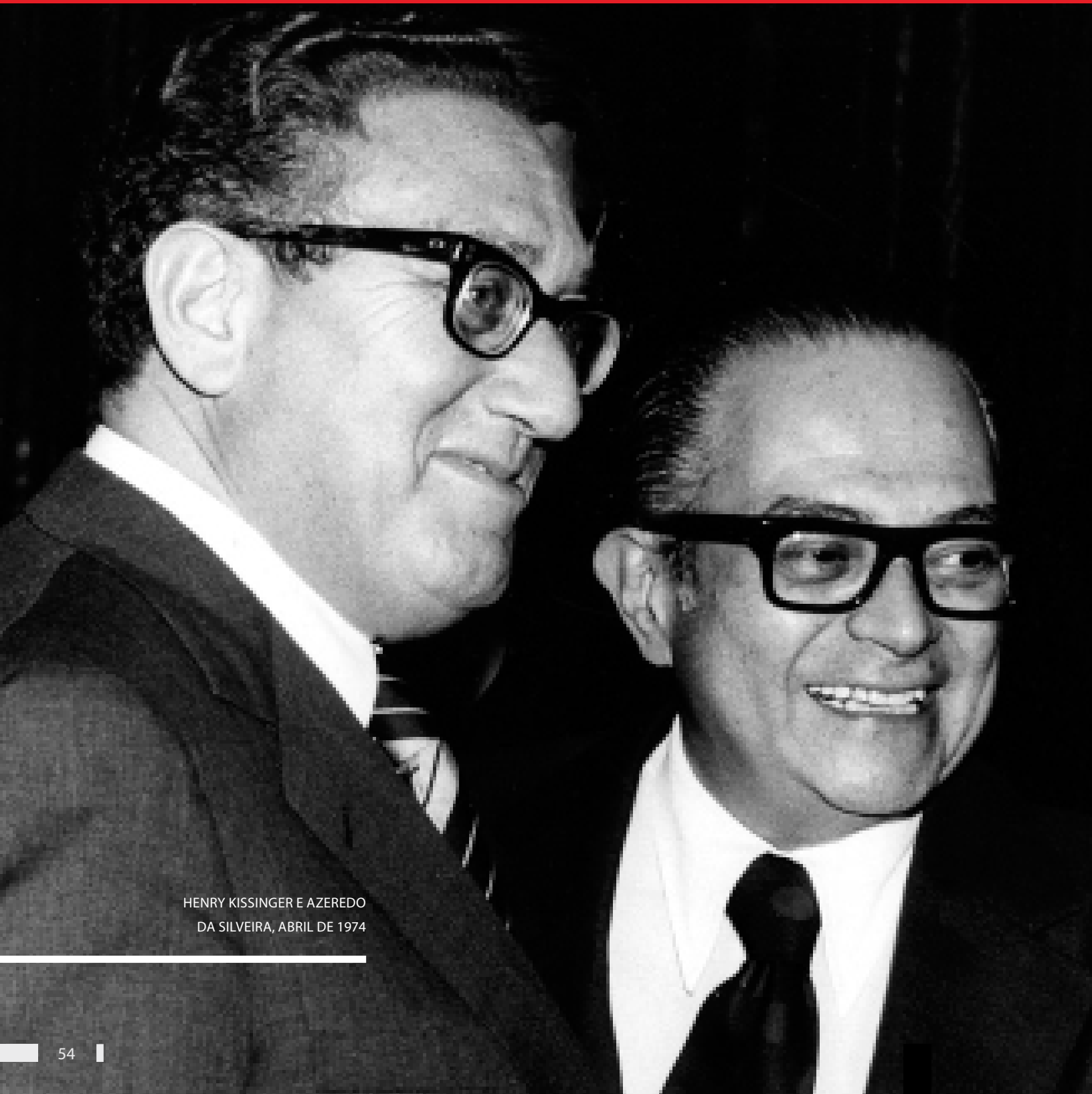
HENRY KISSINGER E AZEREDO DA SILVEIRA, ABRIL DE 1974