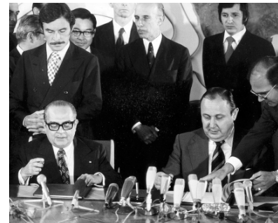
OS MINISTROS DAS RELAÇÕES EXTERIORES DO BRASIL E DA ALEMANHA ASSINAM O ACORDO NUCLEAR DE 1975

Integro o núcleo de pesquisa sobre a história do programa nuclear brasileiro e da cooperação nuclear entre Brasil e Argentina. Acabo de defender uma tese de doutorado sobre o papel do Brasil na ordem nuclear global. É um grande privilégio estar com vocês hoje. Entendo que este exercício será fundamental para os estudos futuros sobre a história nuclear argentino-brasileira. 10